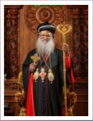
H.G. BASELIOS MARTHOMA MATHEWS III ( Catholicos & Malankara Metropolitan)