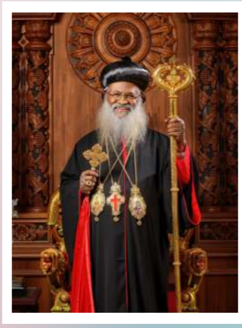
( Special Guest ) H.G. BASELIOS MARTHOMA MATHEWS III