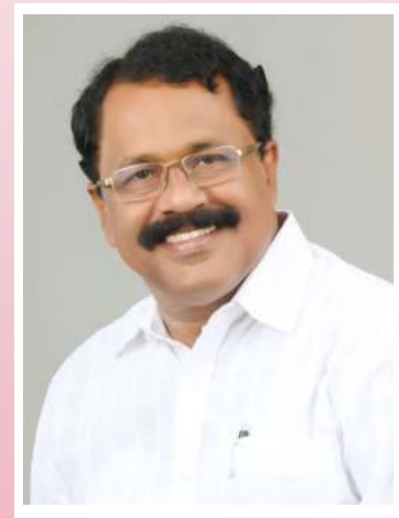
Inauguration by ( Hon.Goa governer) H.E. Sri.P.S Sreedharan Pillai